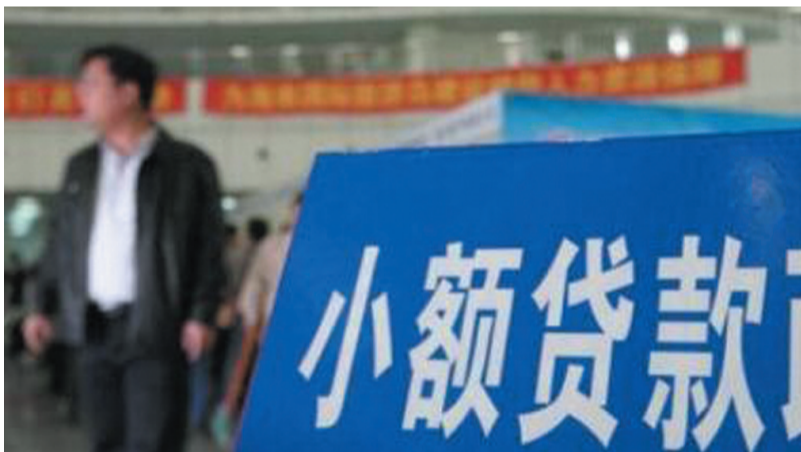
近5年海南小贷公司基本情况